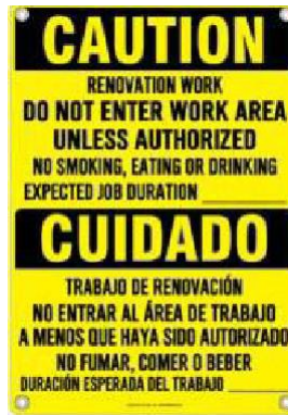
Imagen 4: ejemplo de señalización