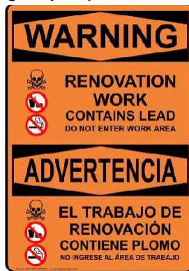
Imagen 5: ejemplo de señalización

Si las condiciones del lugar no cumplen lo necesario, se emitirá una orden de suspensión de trabajos hasta que todos los problemas sean resueltos y verificados por el personal del Programa. El tiempo que el proyecto esté en espera se incluirá al calcular la duración de la construcción y se considerará culpa del contratista y estará sujeto a penalización por desempeño. La emisión de cualquier orden de suspensión de trabajos también se tendrá en cuenta al determinar asignaciones futuras y la participación en proyectos futuros.