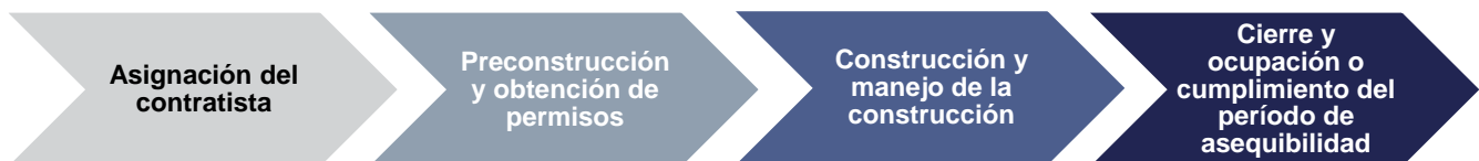
Imagen 3: construcción y cumplimiento

La fase de construcción y cumplimiento, como se observa en Imagen 3, es donde se da asistencia al propietario para la reparación, reconstrucción o reemplazo de la vivienda mediante actividades de construcción directa hechas por el Programa, con el resultado final de una unidad de vivienda rehabilitada. Una vez finalizadas las actividades de construcción y transcurrido cualquier período de cumplimiento, se procederá al cierre de la subvención; esto significa que se completará toda la documentación necesaria para cumplir las normas del HUD y mantener el registro correspondiente.